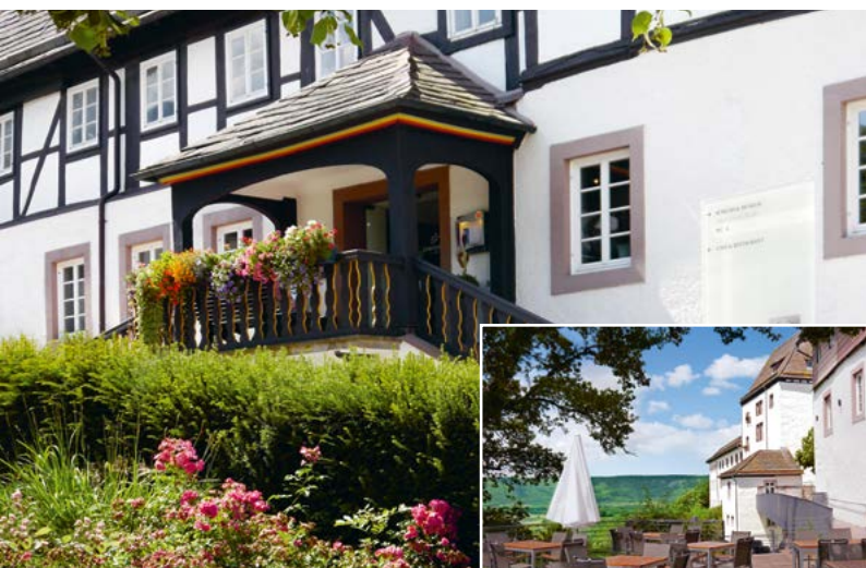
Entrance to café and café terrace.