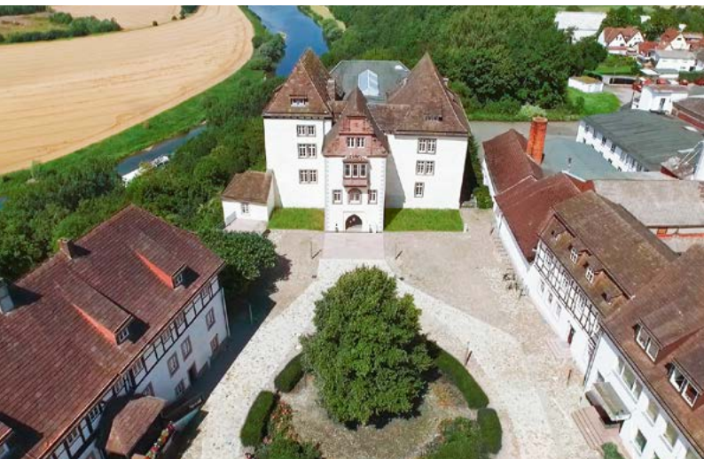
FÜRSTENBERG Weser Renaissance castle.