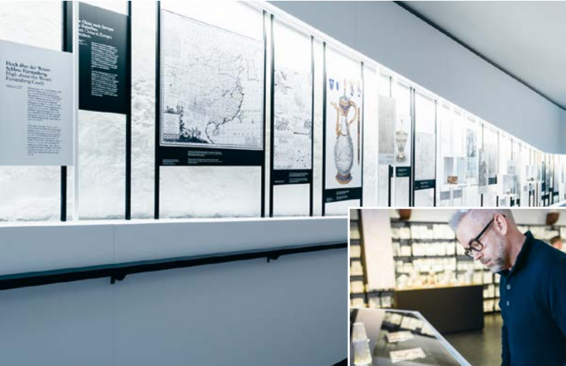
A combination of past and present.

Today, FÜRSTENBERG is a modern manufaktur and the castle ensemble is a popular excursion destination. It is the only porcelain manufaktur still in operation in the same place in which it was founded.